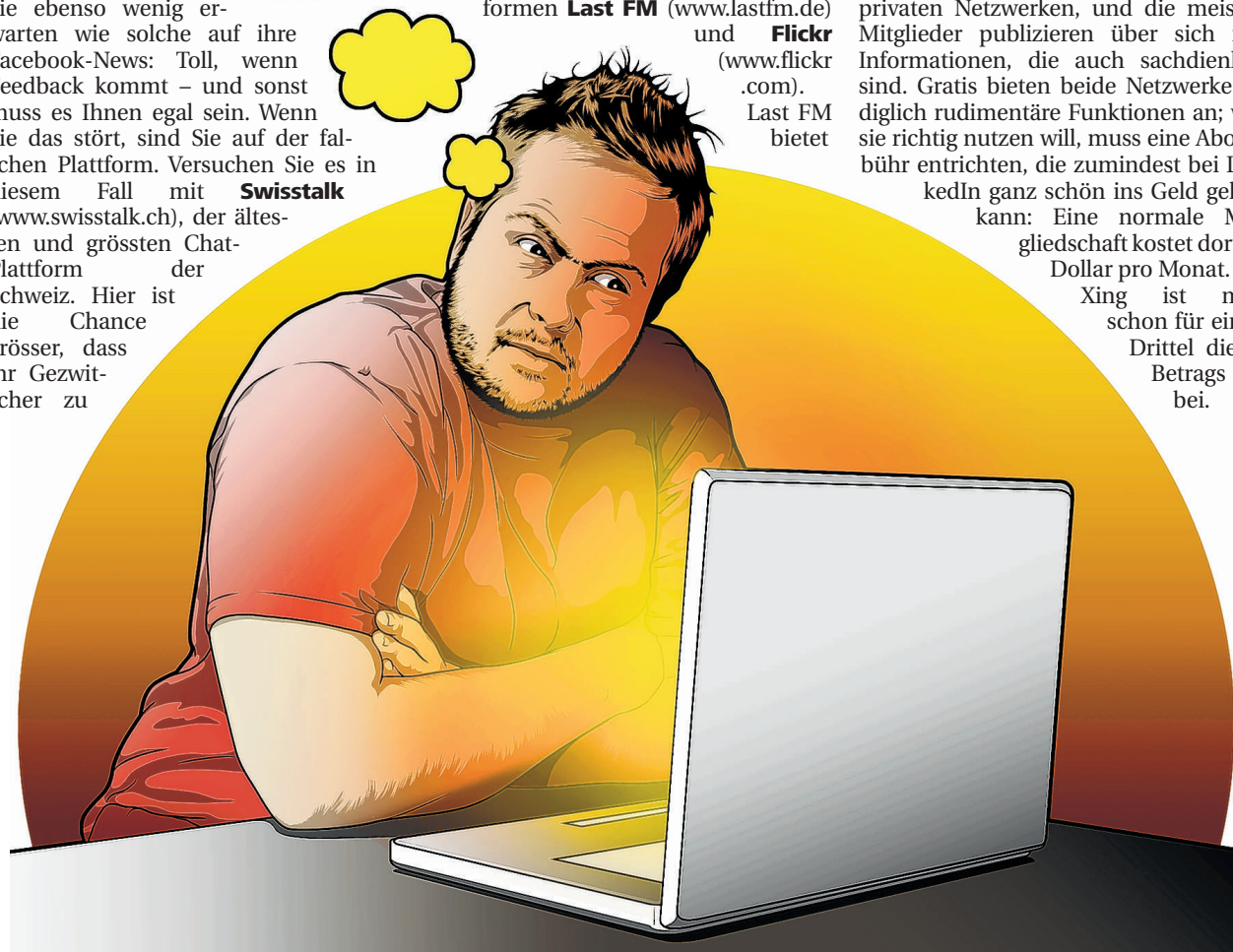
Hüten Sie sich davor, Ihrem Ärger über den Chef auf Facebook Luft zu lassen – das kann ins Auge gehen. ILLUSTRATION BRUNO MUFF